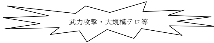
《図：国民保護措置等の実施の流れ》